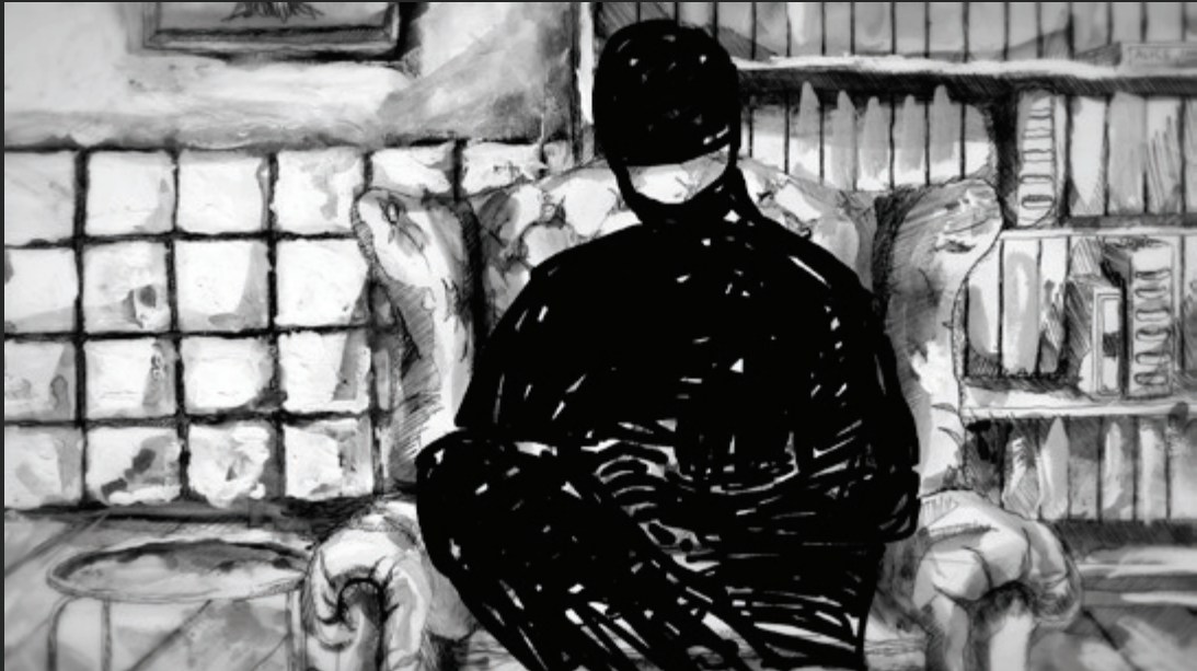
FILMSTILL 02: DER THERAPEUT