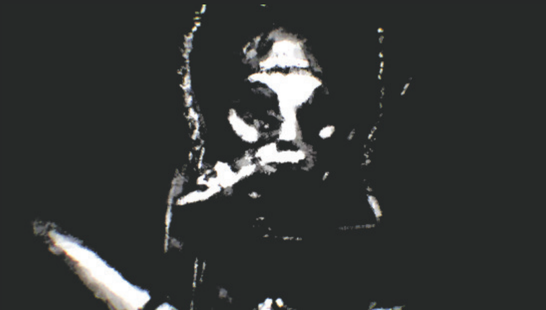
FILMSTILL 03: DER WISSENSCHAFTLER