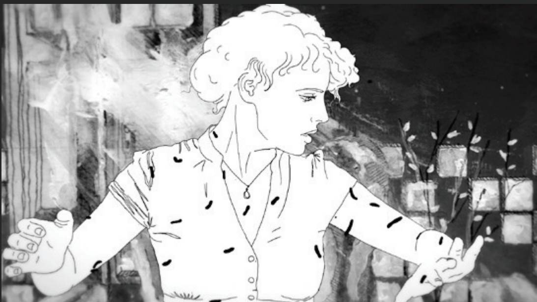
FILMSTILL 04: DIE PATIENTIN