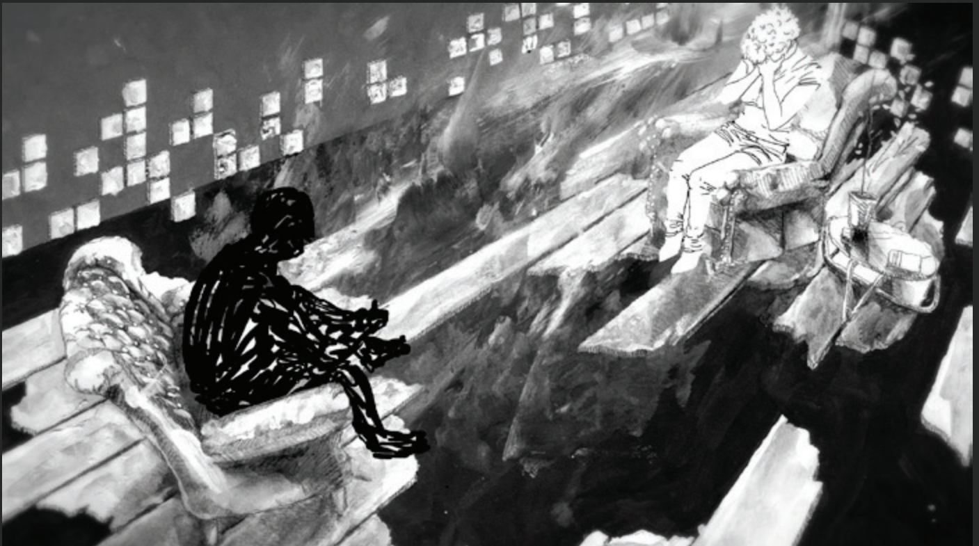
FILMSTILL 01: GESPRÄCHSTHERAPIE